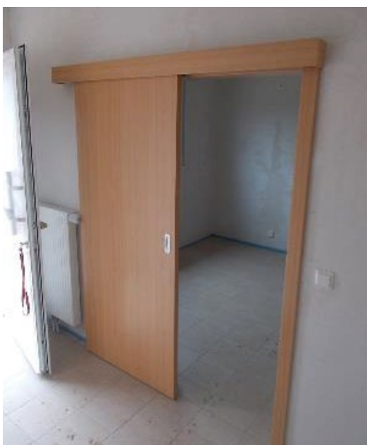
Schiebetür mit Zarge