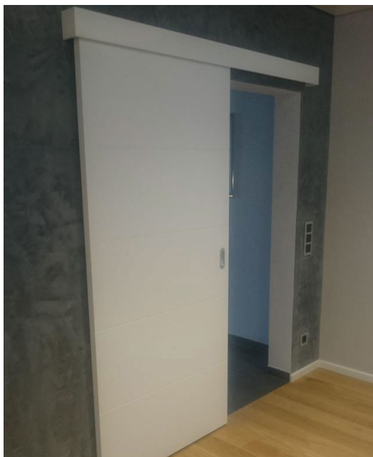
Schiebetür ohne Zarge