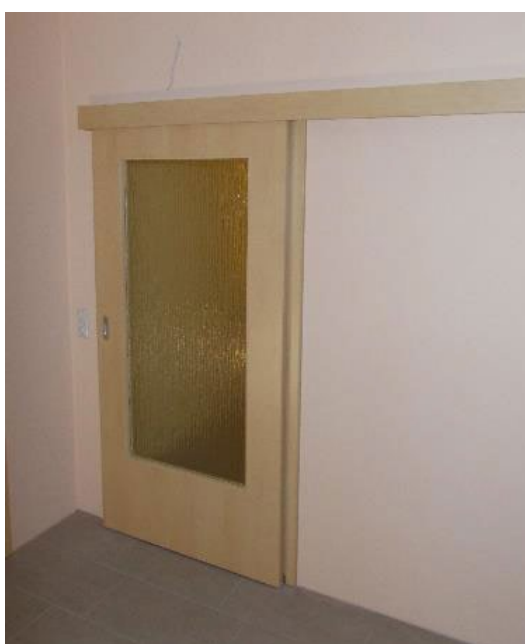
Schiebetür mit Zarge und Normlichtausschnitt