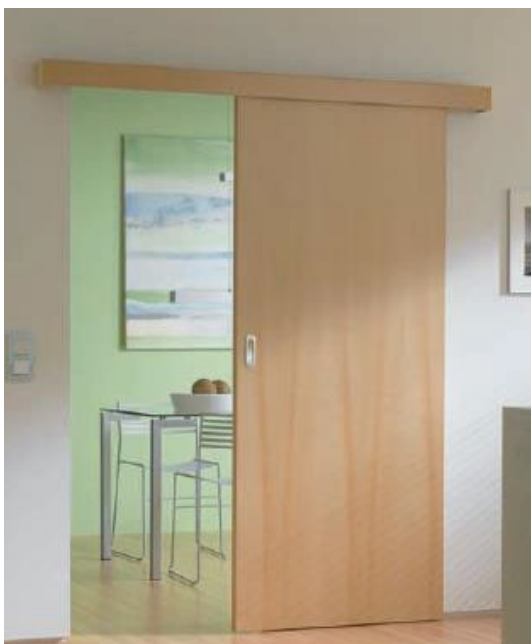
Schiebetür ohne Zarge